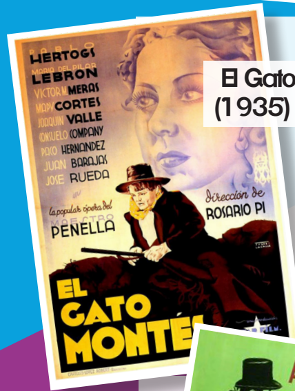
El Gato Montés (1935) Rosario Pi

Como homenaje a sus trayectorias la Filmoteca Española y Fundación First Team dedica el ciclo de directoras pioneras a estas mujeres valientes que decidieron ponerse tras la cámara en unas circunstancias y en un medio que no les iban a ser favorables; sus carreras en el cine, por tanto, se desarrollaron con diferente fortuna.