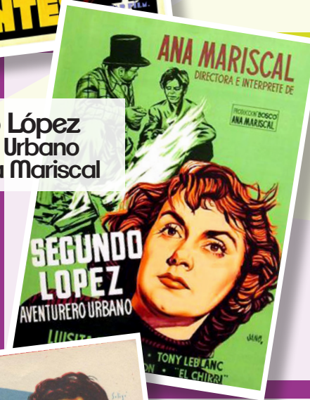
Segundo López Aventurero Urbano (1952) Ana Mariscal

Sinopsis: Melodrama centrado en el triángulo amoroso formado por Soleá, bella y joven gitana, y sus enamorados Juanillo y el torero «El macareno». Juanillo, abocado a la cárcel por una pelea al salir en defensa de Soleá, se convierte en el bandolero «El gato montés».